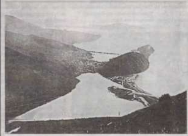
Вид на город Петропавловск-Камчатский с сопки Мишенюк, 1890-е гг.